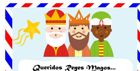
Queridos Reyes Magos...