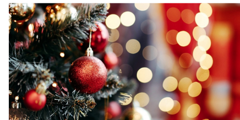
'DÍA DE INICIO DE LA NAVIDAD'