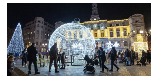
SALIDA. PATINAJE SOBRE HIELO

Durante las Navidades, desde el jueves 22 de diciembre hasta el domingo 8 de enero, el servicio de Jolastxiki será de 10 a 14 y de 16 a 20 h, con excepción de los días 24 y 31 que será sólo de 10 a 14 h. Los días 25 de diciembre, 1 y 6 de enero, Jolastxiki permanecerá cerrado.